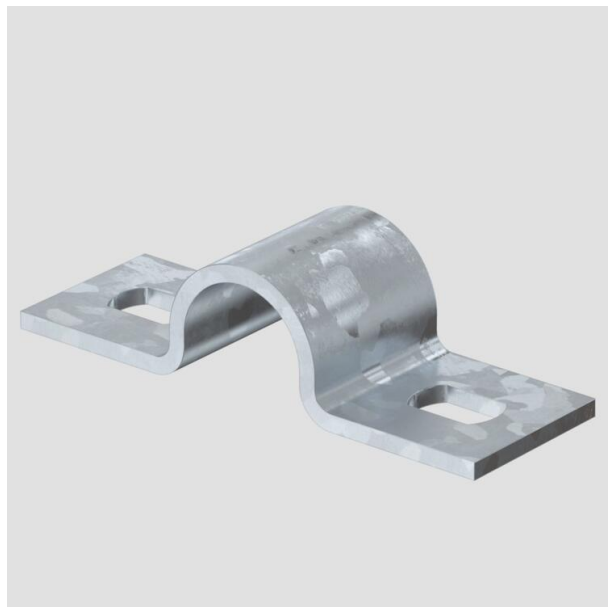
Obejma mocująca dwułapkowa 16mm